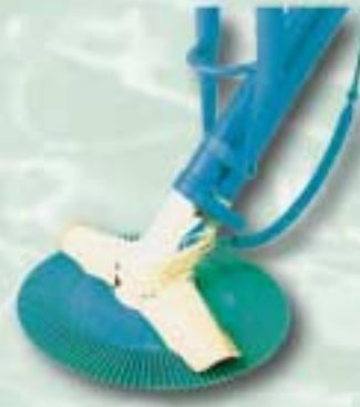
Typ/type: New Generation