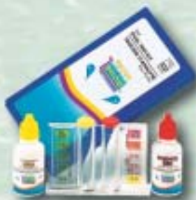
Typ/type: 690207 Typ/type: 690201