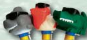
Typ/type: 690077 690079 690078