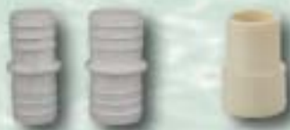
Typ/type: 6141032, 6141038