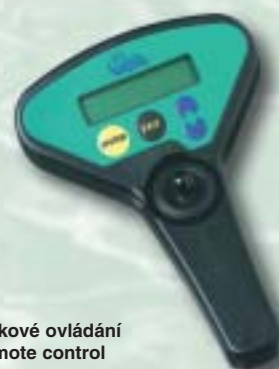
Dálkové ovládání Remote control