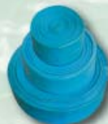
Typ/type: 698902, 04