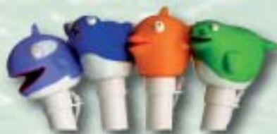
Typ/type: New style